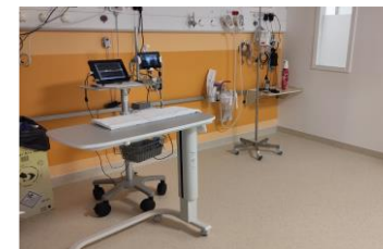
Salle de pose des PICC Line